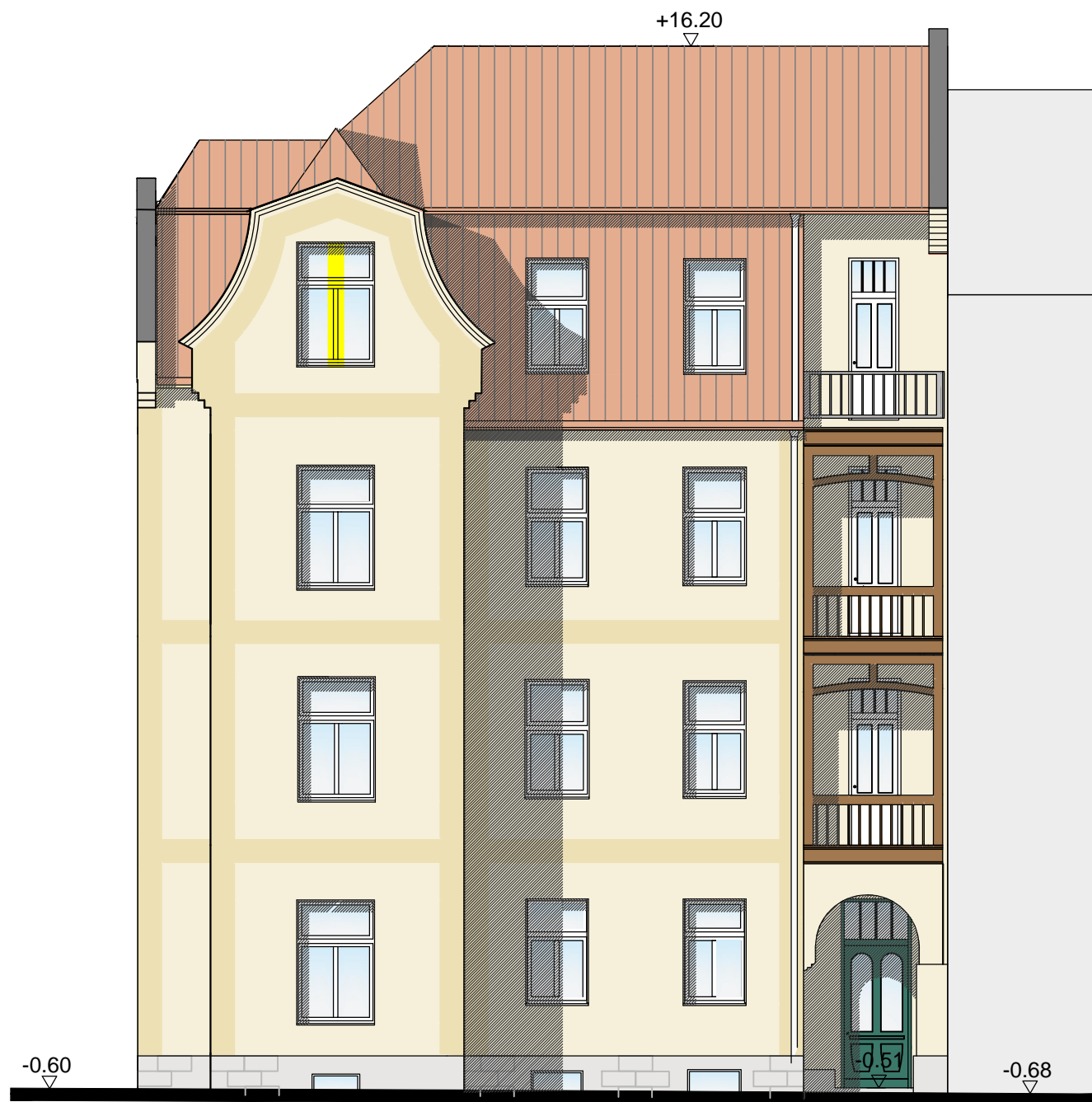
Ansicht Südwest ( Lutherstraße)