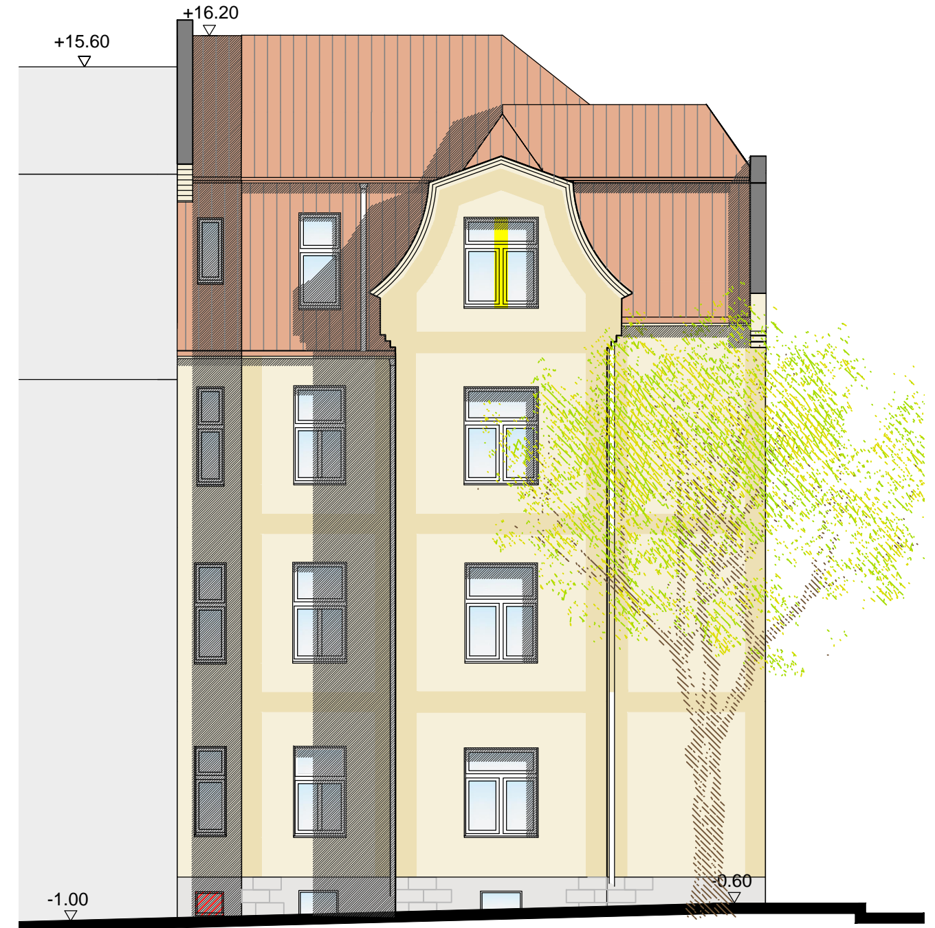
Ansicht Nordwest ( Westendstraße)